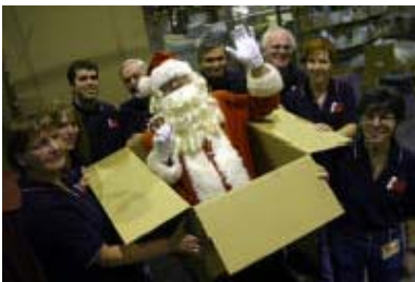
Op Père Noël 2003.

L'opération Père Noël n'est qu'un exemple des avantages des partenariats. Les efforts combinés des CRFM/C, de l'ASPF et des FC devraient susciter de nombreux autres sourires lors de la prochaine fête de Noël.