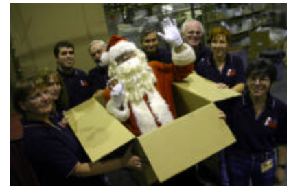
Op Père Noël 2003.

L'opération Père Noël n'est qu'un exemple des avantages des partenariats. Les efforts combinés des CRFM/C, de l'ASPFC et des FC devraient susciter de nombreux autres sourires lors de la prochaine fête de Noël.