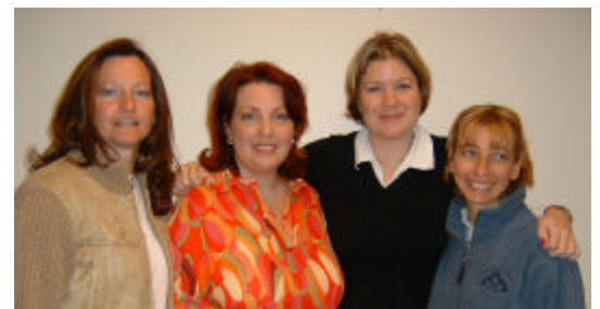
La distribution du CRFM Calgary

Nous souhaitons partager notre expérience positive en matière d'adoption totale du modèle de développement communautaire; si nous avons pu le faire, chaque Centre le peut aussi!